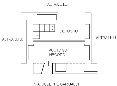
PIANTA PIANO SOPPALCO H = 2,15 m